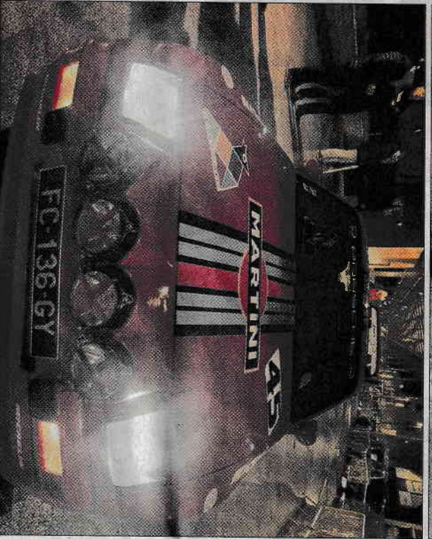
QUAI DU ROI. Les voitures anciennes sont parties pour une épreuve de deux jours sur les routes du Cantal, du Puy-de-Dôme et de l'Ardèche.